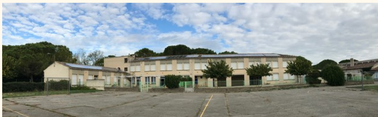
Ecole de Raphèle

Depuis le 3 février, notre première centrale de 36 kWc placée sur le toit de l'école Louis Pergaud à Raphèle est en production. Après un retard dans la mise en service, dû aux lenteurs d'Enedis (3 mois se sont écoulés entre la fin de chantier et la mise en service), nous pouvons partager avec vous notre très grande satisfaction de voir notre but atteint après quatre ans de travail : produire de l'énergie renouvelable grâce à un actionariat citoyen, une étroite collaboration avec les collectivités territoriales (location de toits municipaux, subvention régionale, appui et expertise du Pôle territorial et rural du Pays d'Arles), un bénévolat convaincu et efficace.